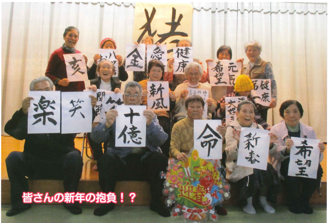
皆さんの新年の抱負!?