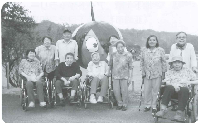
みんなで出かけ、いい笑顔！後ろのかかしは何だっけ？