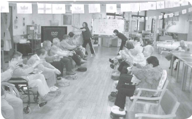
「よし、がんばるぞ」その前に準備体操をしっかりと！