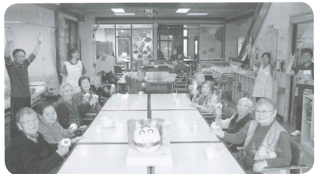
みんなで干支の「亥」を完成させました！

天然かけ流し温泉に入り、ご自分の足でしっかり歩けるように体操を行ったり、いきいき過ごして頂けるよう職員一同お手伝いさせていただきます。